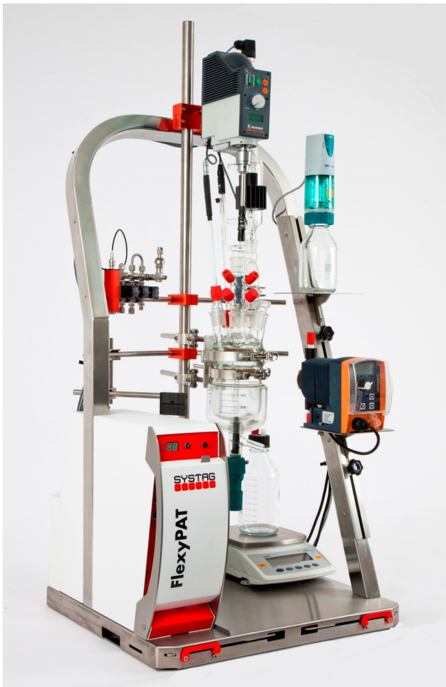
FlexyPAT Caddy als Tischmodell