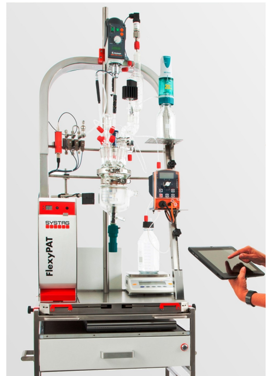
Bedienung mit Tablet WiFi